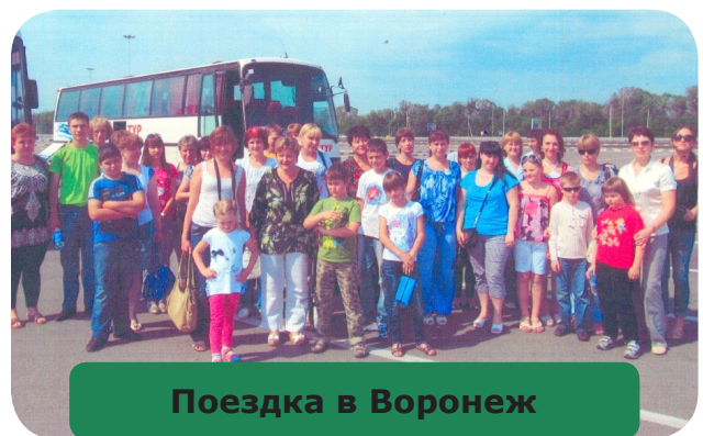
Поездка в Воронеж