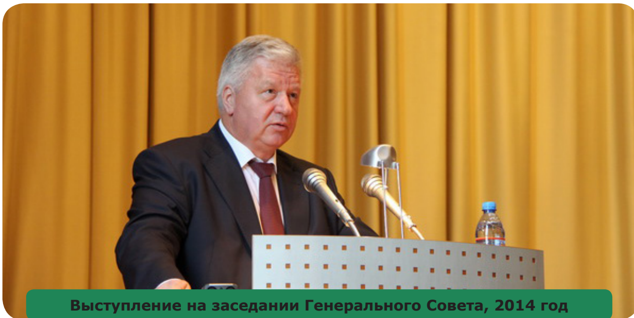
Выступление на заседании Генерального Совета, 2014 год

мость в организации «горячих линий», «столов консультаций», консультаций в трудовых коллективах, обучении профсоюзных работников и активистов вопросам пенсионного законодательства, активизации работы на предприятиях пенсионных комиссий.