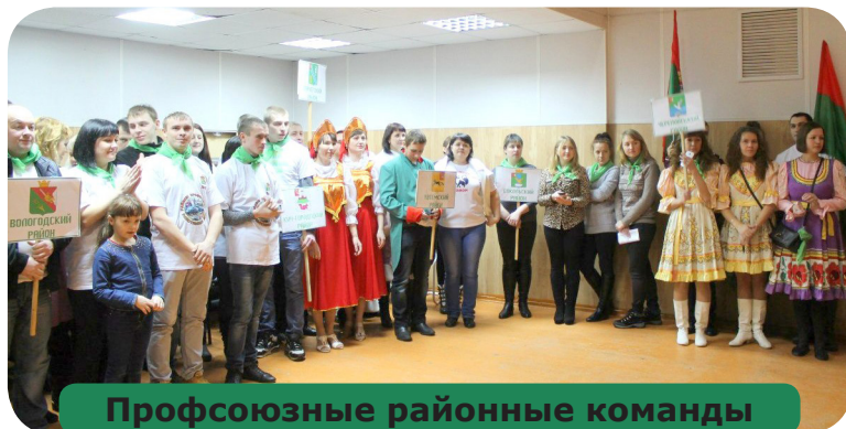
Профсоюзные районные команды

Команда ВГМХА рассказала о профессиях АПК: ветеринарах, технологах, агрономах. Команда